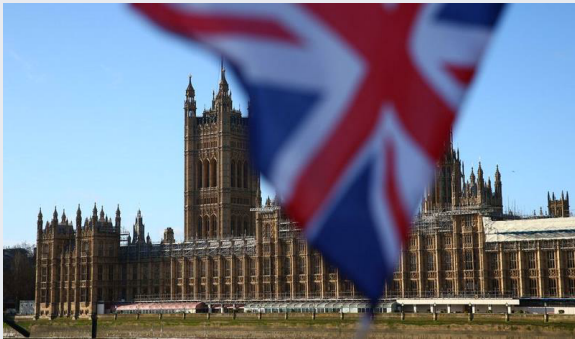
El Caso UK